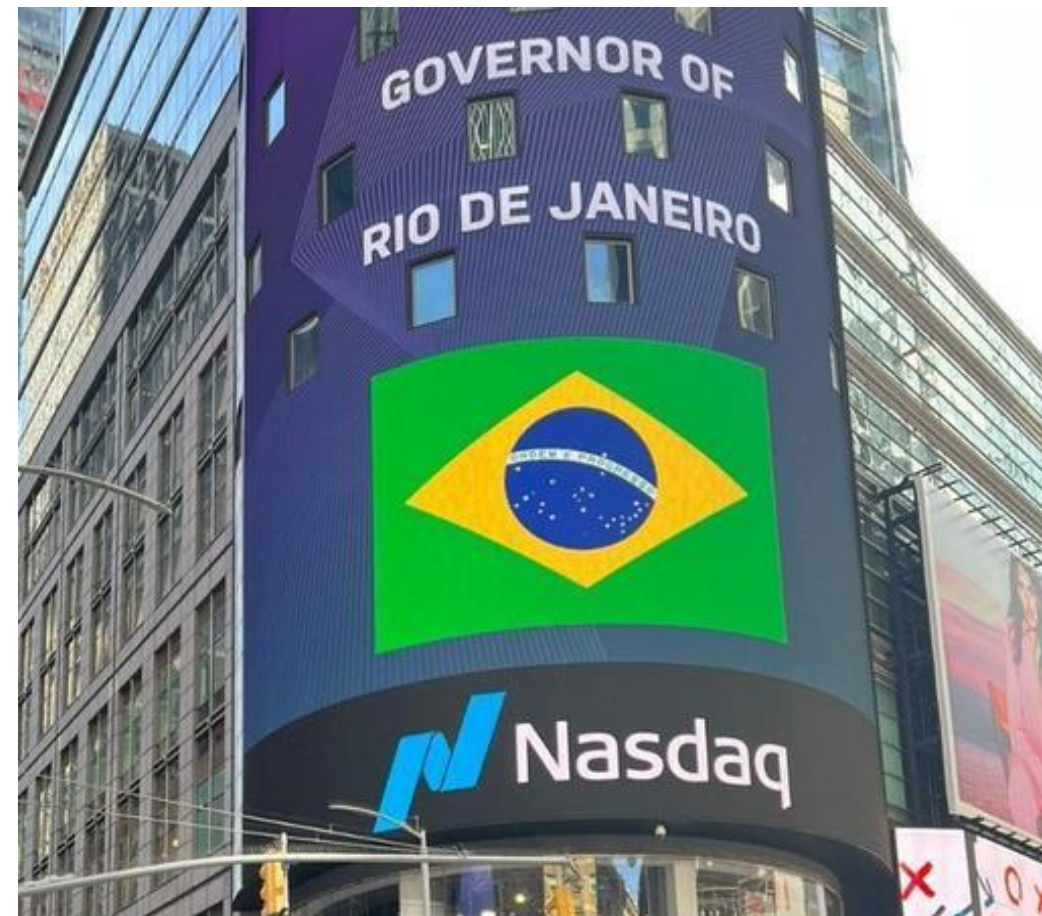
Painel da Nasdaq, na Times Square, durante assinatura do protocolo.