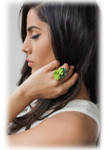
JOIAS VIVAS Continuam Crescendo