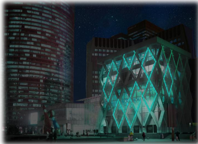
SISTEMA DE ILUMINAÇÃO Base de Microorganismos