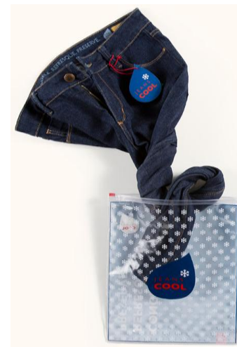
JEANS COOL Não lava, coloca no freezer!